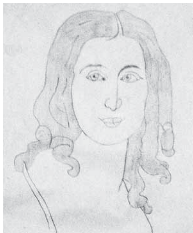
En tegning af Martin.

Hvis nogen undrer sig over at vi kunne bruge en hel uge til det her, så hænger det sammen med skolens tradition for at have "tværsuger", hvor vi bryder skemaet op og kan fordybe os i et emne.